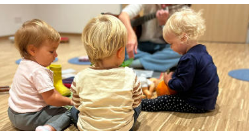
10 Kinder &amp; Familien