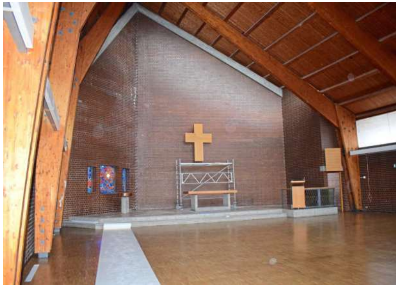
Der Parkettboden in der Kirche der Evangelischen Gemeinde Bühl wurde neu versiegelt, die Lichttechnik erneuert und neue Fenster verbaut.