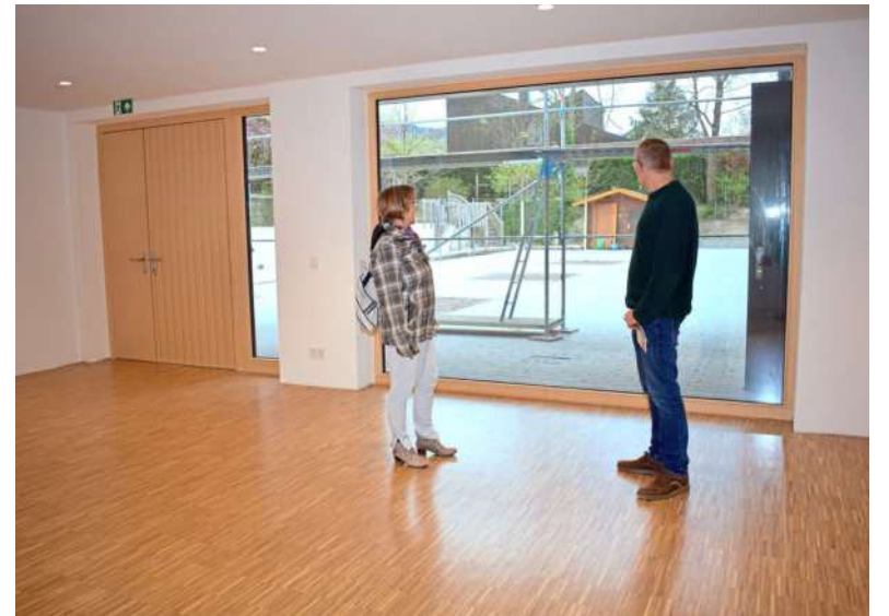
Vom neuen Turnraum für die Kindergartenkinder geht der Blick hinaus in den großzügig konzipierten Außenbereich.