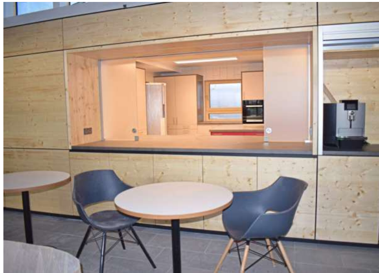
Im neu entstandenen Forum gibt es eine große Küche, viele Sitzmöglichkeiten und eine Kaffeemaschine.